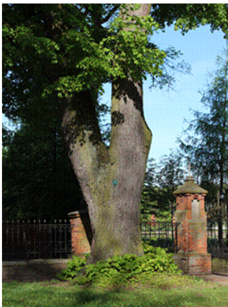
Pomnik przyrody w Cegłowie