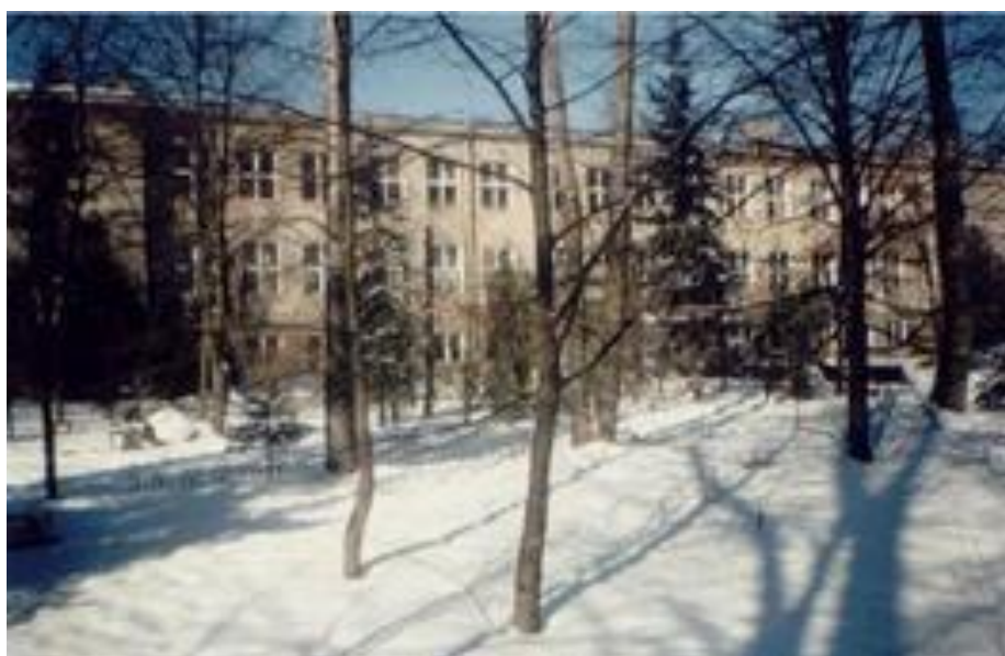
Tablica 3: Szkolnictwo publiczne podstawowe, gimnazjum i przedszkole w miejscowości Cegłów w 2007/2008 r.

W Zespole działa świetlica i stołówka szkolna. Zespół dysponuje dużym terenem na którym znajdują się boiska sportowe oraz duże wolne powierzchnie, w przyszłości służące do zabudowy urządzeniami sportowymi bądź edukacyjnymi.