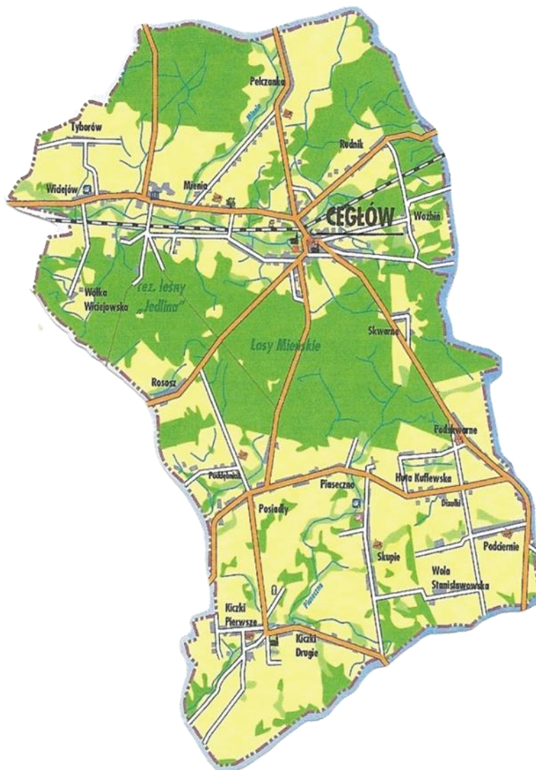
Mapa Gminy Cegłów

Cegłów leży w odległości 50 km od Warszawy, 11 km od Mińska Mazowieckiego i 45 km od Siedlec. Na koniec 2013 roku w m. Cegłów mieszkało 2199 osób, co w stosunku do liczby ogółem mieszkańców (6121 osoby) w gminie Cegłów wynosi 35,93%. Miejscowość Cegłów zajmuje obszar 8,61 km 2 .