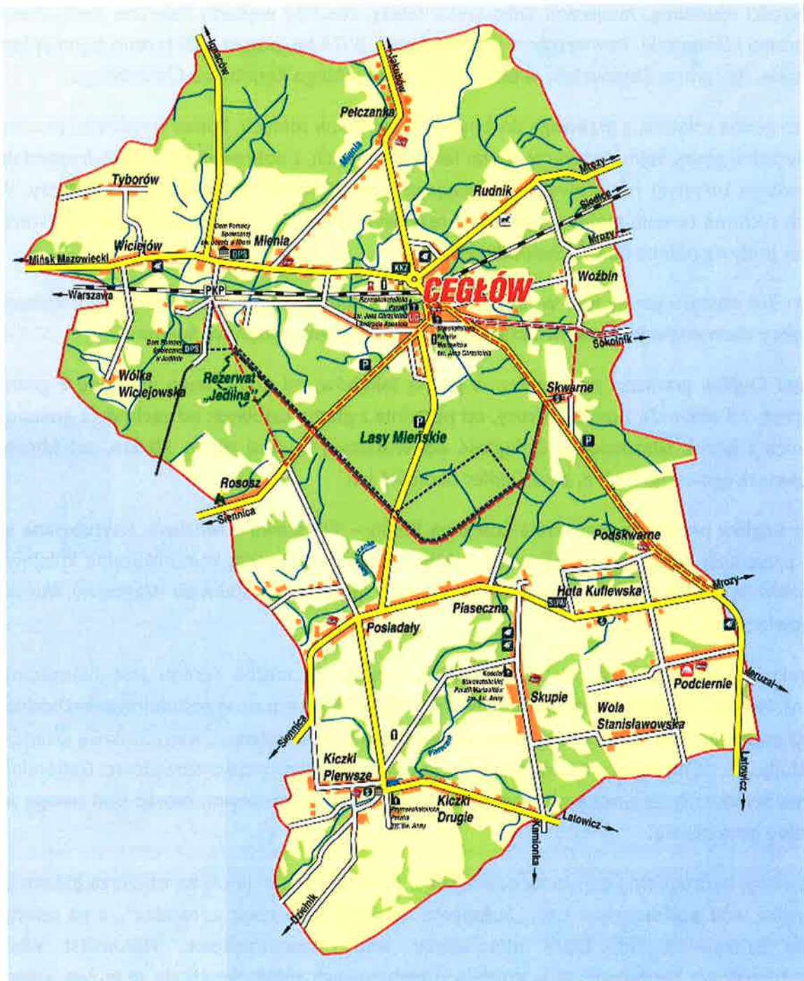
Mapa gminy Cegłów

Przez Gminę przepływają dwa prawostronne dopływy Świdra, czyli rzeka Mienia i rzeka Piaseczna.